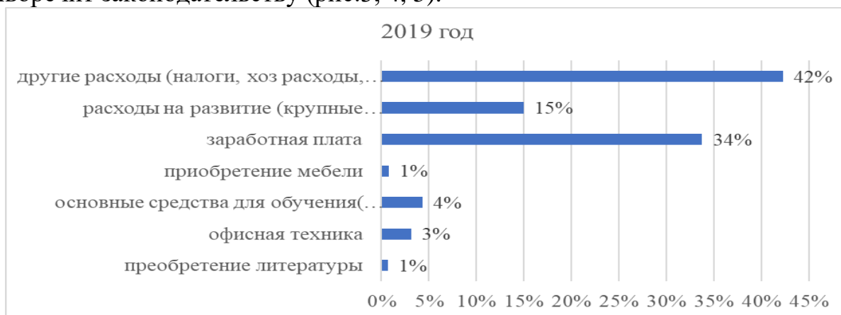
Рис.3. Средства, выделенные на обновление фонда в 2019 году

Средства на финансирование и обновление фонда образовательных программ, от доходов по оказанию платных образовательных услуг не противоречит законодательству (рис.3, 4, 5).