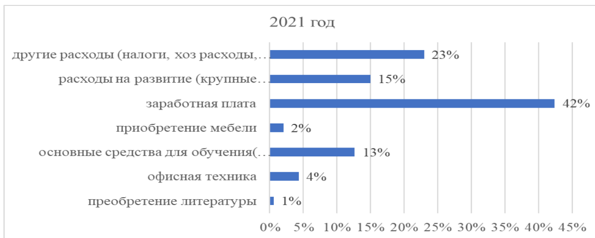
Рис.5. Средства, выделенные на обновление фонда в 2021 году